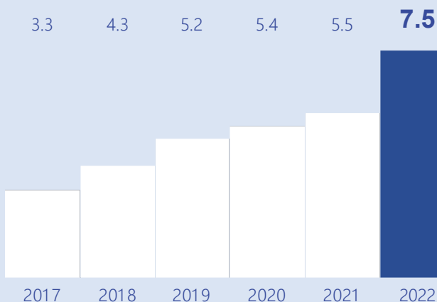
Объем средств, полученных от НИОКР, в млрд руб.